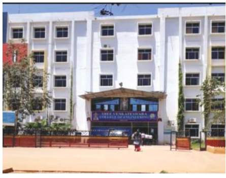
జరిగే నాలుగు కేంద్రాల్లో పరీక్షితులను తెలుసుకున్నారు. మధ్యాహ్నం 3 నుంచి 6 గంటల వరకు కూడా ఈ నాలుగు కేంద్రాల్లో పరీక్ష జరుగుతుంది. ఈసారి అభ్యర్థులు మాస్కులు, గ్లోజెలతో పరీక్ష రాస్తున్నారు. ప్రతి పరీక్షా కేంద్రంలో శానిటైజర్ ను అందుబాటులో ఉంచారు.

నెల్లూరు సెప్టెంబర్ వార్తాపత్ర 1 : జిల్లాలో జేఈఈ మెయిన్స్ పరీక్షలు ప్రశాంతంగా జరుగుతున్నాయి. ఉదయం 9 గంటల నుంచి నెల్లూరు నారాయణ ఇంజనీరింగ్ కళాశాల, కొడవలూరు వెంకటేశ్వర ఇంజనీరింగ్ కళాశాల, గూడూరు లోని ఆదిశంకర 1, 2 కేంద్రాల్లో పరీక్ష ప్రారంభమైంది. ఈసారి జిల్లా నుంచి బి.బి.టి, ఎస్.బి.టి. ప్రవేశాల కోసం జేఈఈ మెయిన్స్ ద్వారా 4,200 మంది తమ అర్హత పూర్తి పరీక్షించుకుంటున్నారు. కోవిడ్ - 19 మహమ్మారి నేపథ్యంలో ప్రతి ఒక్కరిని ధర్మల్ స్యానింగ్ చేసిన అనంతరం పరీక్ష కేంద్రంలోకి పంపారు అలాగే పరీక్ష కేంద్రాలను ఎప్పటి కప్పుడు శానిటైజేషన్ చేస్తున్నారు. జిల్లా ఉన్నతాధికారులు ఎప్పటికప్పుడు జే.ఈ.ఈ మెయిన్స్ పరీక్ష