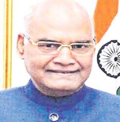
కశ్మీర్, డోంగ్రి, హిందీలు జమ్మూకశ్మీర్లో ఉర్దూ, ఇంగ్లీష్ పాఠాలు కశ్మీర్, డోంగ్రి, హిందీలకు అధికార భాషల హోదా కల్పించే బిల్లును కూడా రాష్ట్రపతి కోవింద్ ఆమోదించారు. ఈ మేరకు గెజిట్ నోటిఫికేషన్ విడుదలయింది. జమ్మూకశ్మీర్ అధికార భాషల బిల్లు-2020ను ఇటీవలి వర్షాకాల సమావేశాల్లో పార్లమెంట్ ఆమోదించింది.

న్యూఢిల్లీ: పంజాబ్, హరియాణా రాష్ట్రాల్లో రైతుల ఆందోళనలకు కారణమైన వ్యవసాయ బిల్లులు చట్టరూపం దాల్చాయి. ఆదివారం విడుదలైన గెజిట్ నోటిఫికేషన్ ప్రకారం రాష్ట్రపతి రామ్ నాథ్ కోవింద్ మూడు బిల్లులను ఆమోదించారు. అవి.. రైతు ఉత్పత్తుల వాణిజ్యం, వ్యాపారం (ప్రోత్సాహం, వసతుల కల్పన) బిల్లు-2020, రైతు(సాధికారత, రక్షణ) ధరల హామీ, వ్యవసాయ సేవల బిల్లు-2020, నిత్యావసరాల(సవరణ) బిల్లు-2020. వీటిలో.. రైతు ఉత్పత్తుల వాణిజ్యం, వ్యాపారం (ప్రోత్సాహం, వసతుల కల్పన) బిల్లు అమల్లోకి వస్తే రైతులు తమ వ్యవసాయ ఉత్పత్తులను రాష్ట్రాల ఆధీనంలోని మండలాలకు వెలుపల విక్రయించుకునే వెసులుబాటు ఉంటుంది. అదేవిధంగా, రైతు(సాధికారత, రక్షణ) ధరల హామీ, వ్యవసాయ సేవల చట్టంతో కాంక్రీటు వ్యవసాయానికి దారులు తెరుచుకుంటాయి. మూడోది.. నిత్యావసరాల(సవరణ) బిల్లు. దీని ద్వారా బంగాళా దుంపలు, ఉల్లిగడ్డలు, వంటనూనెలు, చిరుధాన్యాలు సరఫరా, ఉత్పత్తి, పంపిణీపై నియంత్రణలు తొలగిపోతాయి. ఈ బిల్లులను పార్లమెంట్లో ప్రవేశపెట్టిన సమయంలో కూడా ప్రతిపక్షం నిరసనలు తెలిపింది. ఈ బిల్లులను నిరసిస్తూ అధికార ఎన్డీఎ నుంచి శిరోమణీ అకాలీ దళ్ పార్టీ బయటకు వచ్చింది.