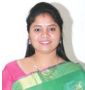
జయప్రకాశం, వార్తావళి, సెప్టెంబర్ 19: పూర్తిగా పాల్వేరు వాహన రాకపోకలకు తీవ్ర అంతరాయం కలుగుతున్న రాయగడ రోడ్డు తక్షణ మరమ్మత్తుల కోసం ప్రభుత్వం రూ.1.06 కోట్ల మంజూరు చేసింది. రాష్ట్ర ఉప ముఖ్యమంత్రి పుష్ప కృపాణి వెల్లడించారు. అలాగే ఈ రహదారిలో పూర్తి స్థాయిలో రిపేర్లు చేపట్టడానికి ఆదనంగా మరో రూ. 6 కోట్ల మంజూరు చేయాలని కూడా ప్రతిపాదించామని తెలిపారు.

జయప్రకాశం, వార్తావళి, సెప్టెంబర్ 19: పూర్తిగా పాల్వేరు వాహన రాకపోకలకు తీవ్ర అంతరాయం కలుగుతున్న రాయగడ రోడ్డు తక్షణ మరమ్మత్తుల కోసం ప్రభుత్వం రూ.1.06 కోట్ల మంజూరు చేసింది. రాష్ట్ర ఉప ముఖ్యమంత్రి పుష్ప కృపాణి వెల్లడించారు. అలాగే ఈ రహదారిలో పూర్తి స్థాయిలో రిపేర్లు చేపట్టడానికి ఆదనంగా మరో రూ. 6 కోట్ల మంజూరు చేయాలని కూడా ప్రతిపాదించామని తెలిపారు. జిల్లాలోని చిలకపాలెం నుంచి రామభద్రాపురం మీదుగా రాయగడ వెళ్లే రాష్ట్ర రహదారి ఈ మధ్యకాలంలో పూర్తిగా పాల్వేరువనం దాటినందుకు గురై మిట్టల్లో దిగిపోవడం, ట్రాఫిక్ గంటల తరబడిగా అంతరాయం ఏర్పడటంతో ఈ రహదారిలో ప్రయాణం చాలా ఇబ్బందికరంగా మారింది. విషయం అందరికీ తెలిసింది. ముఖ్యంగా ఈ రహదారిలో పాల్వేరు నుంచి కొమడ వరకు ఉన్న రోడ్డు పరిస్థితి అభయంగా ఉండటంతో ఈ నెల రోజులుగా పాల్వేరు నుండి కొమడ వరకు రోడ్డు పూర్తిగా పాదపథంలో ట్రాఫిక్ సమస్యలో పూర్తిగా స్తంభిందింది. ఈ విషయంగా స్పందించిన ఉపముఖ్యమంత్రి పుష్ప కృపాణి ఈ రహదారి మరమ్మత్తులను వెంటనే చేపట్టడానికి చర్యలు తీసుకోవాలని అందుకు అనుకూలమైన నిధులు వెంటనే విడుదల చేయాలని ఆర్ అండ్ బీ అధికారులను కోరారు. ఈ సేవలను ప్రభుత్వ ప్రత్యేకంగా సమీక్షా సమావేశాన్ని నిర్వహించి తో ఆర్ అండ్ బీ అధికారులు రాయగడ రోడ్డులో పాల్వేరు నుండి కొమడ వరకు రోడ్డు తక్షణ మరమ్మత్తుల నిమిత్తం ఈ మేరకు నిధులు మంజూరు అయ్యేలా చూస్తూ, పూర్తి స్థాయిలో సమస్య పరిష్కారం చేస్తామని ఈ సందర్భంగా పుష్ప కృపాణి హామీ ఇచ్చారు.