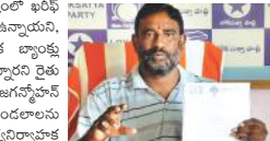
సీఎం జగన్ కరువు మండలాలను ప్రకటించాలి: భీశెట్టి. సీఎం జగన్ కరువు మండలాలను ప్రకటించాలి: భీశెట్టి.